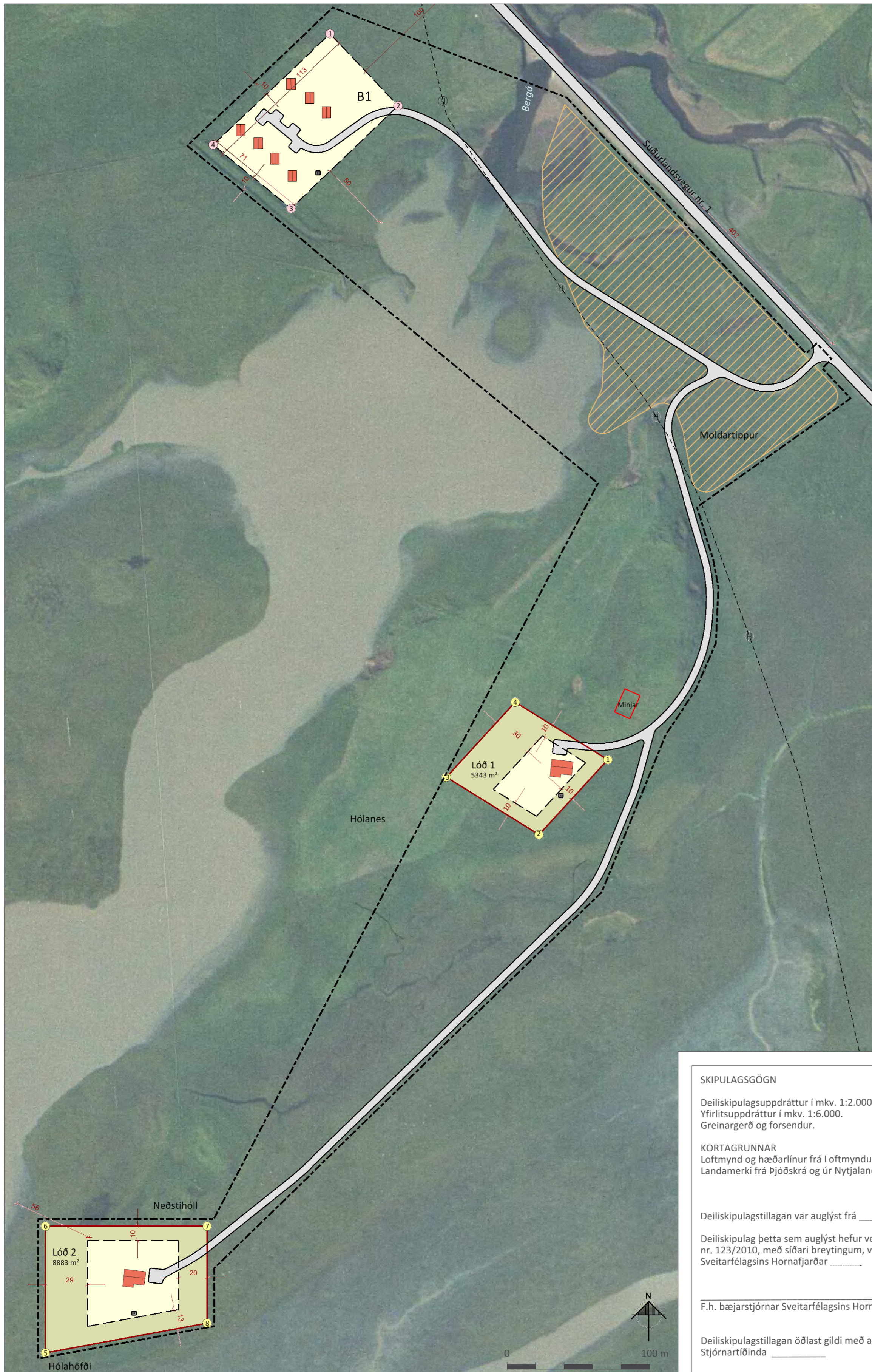
Deiliskipulagsuppráttur í mkv. 1:2.000.