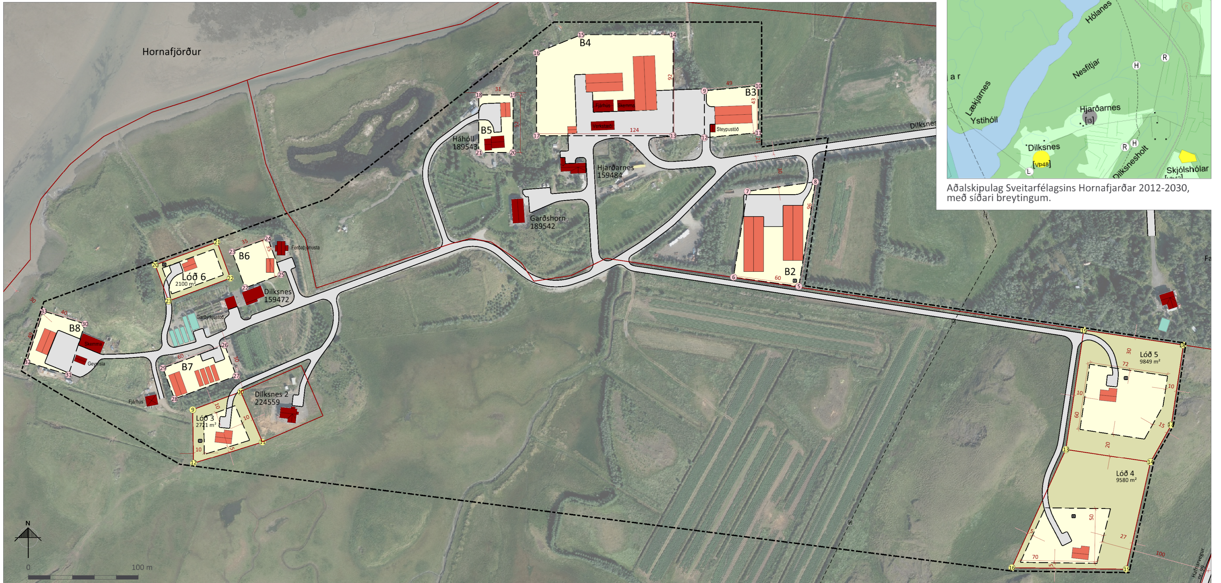
Deiliskipulagsuppráttur í mkv. 1:2.000.